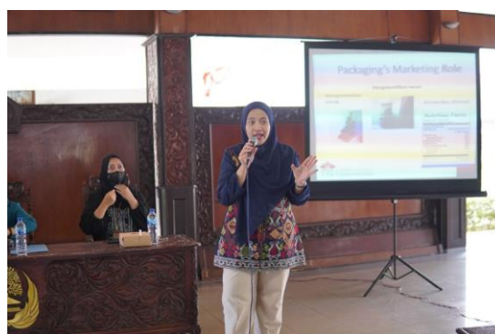
Gambar 3. Pemaparan Materi Digitalisasi Pemasaran