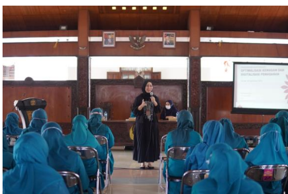
Gambar 2. Pemaparan Materi Pelatihan

Berdasarkan hasil diskusi yang dilakukan sehingga mengetahui permasalahan yang dihadapi oleh mitra, Tim Pengabdian Masyarakat membuat sebuah kegiatan yang dikemas dalam bentuk pelatihan. Adapun topik yang diangkat adalah “Optimalisasi Kemasan dan Digitalisasi Pemasaran”. Topik tersebut diambil sebagai solusi atas permasalahan yang dihadapi oleh mitra. Sehingga dirapkan dengan adanya pelatihan ini menjadi salah satu langkah untuk menyelesaikan keresahan mitra khususnya Ibu-ibu PKK Kabupaten Gresik. Pelatihan dilakukan di Pendopo bupati Gresik pada tanggal 8 September 2022 dengan waktu