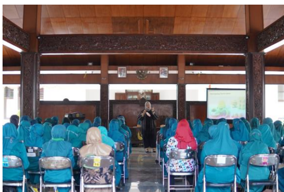
Gambar 4. Pemaparan Materi Optimalisasi Kemasan

Penjelasan materi “Optimalisasi Kemasan” memaparkan sebuah materi terkait pengenalan kemasan produk. Pada materi ini