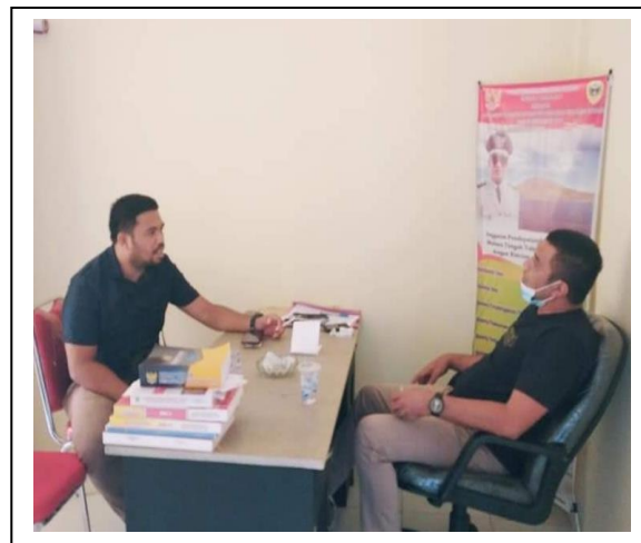
Gambar 4. Proses Wawancara dengan Kepala Desa