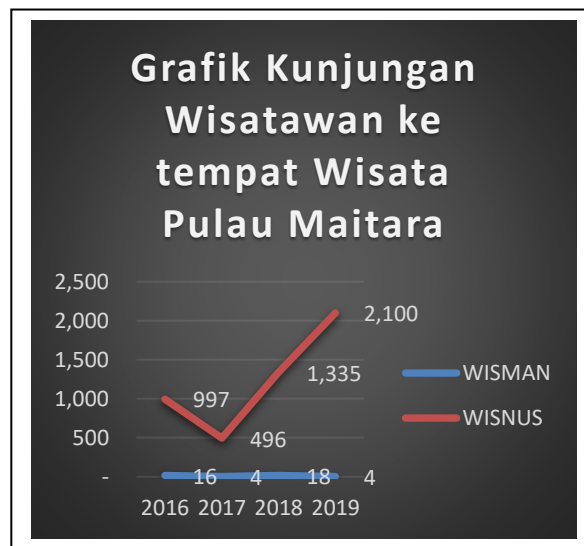
Gambar 3. Grafik Kunjungan Wisata

Dari hasil wawancara diatas dapat menunjukkan bahwa program kerja sama PKM yang dilaksanakan oleh TIM PKM Unkhair dan pemerintah Desa Maitara Tengah memberikan dampak bagi kehidupan dari aspek pariwisata dan ekonomi untuk masyarakat Desa Maitara Tengah.