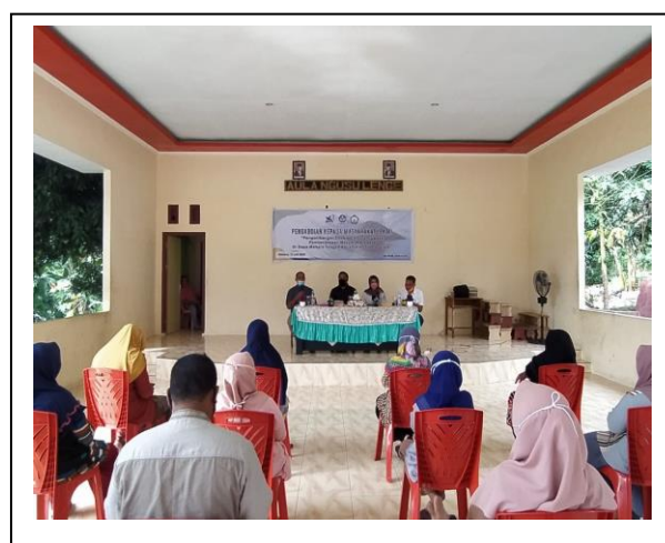
Gambar 2. Pelaksanaan PKM

pengembangan ekonomi dalam pengelolaan ekowisata dan ekowisata bagi pengembangan masyarakat di Pulau Maitara, perlu dilakukan inisiasi mulai dari kelompok-kelompok ekonomi kecil yang tidak produktif yang berada di Desa Maitara Tengah. Kegiatan pengabdian ini akan fokus pada 2 sub kegiatan pelatihan dan pendampingan, yaitu pelatihan pengembangan usaha dan pelatihan pengelolaan ekowisata.